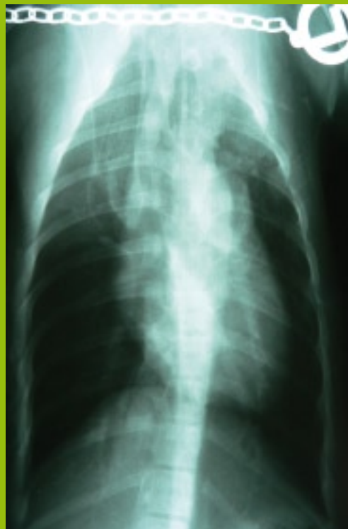
Abb. 4 Röntgen dorso-ventraler Strahlengang, Schneeleopard 14 Wochen, unседiert. Weitung des Pulmonalarteriensegmentes.