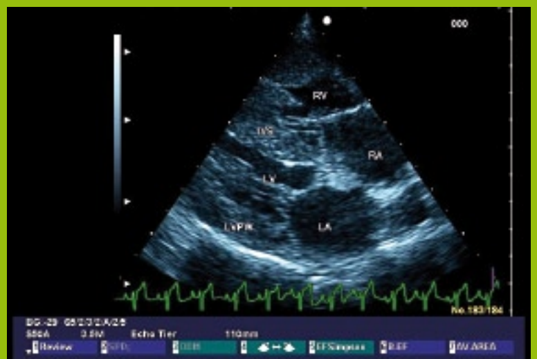
Abb. 2: Zweidimensionales Echokardiogramm, rechtsparasternaler Langachsenblick. Hypertrophie des rechtsventrikulären Myokardiums.