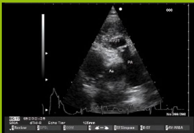
Abb. 1: Zweidimensionales Echokardiogramm: valvuläre Pulmonalstenose (PV), Hypertrophie des rechten Ventrikels.

Einer der Wildparks in Deutschland, der erfolgreich am Artenschutz und Zuchtprojekt der Schneeleoparden teilnimmt, ist der Wildpark Lüneburger Heide, der auch Schauplatz der 40-teiligen Doku-Soap „Wolf-Bär&Co.“ in der ARD war. www.wild-park.de